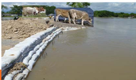
Muchos ganaderos llevan el ganado para que beba en los ríos lo cual debilita los jarillones y al producirse una creciente la consecuencia lógica es una inundación.

El romper una parte de los jarillones para que sirva de abrevaderos de ganados, cerdos, caballos; la siembra de árboles en los mismos cuyas raíces agrietan y desmoronan su estructura natural; los cerdos al hozar en busca de lombrices y otros insectos con su hocico hacen numerosas y grandes perforaciones; sembrados de hortalizas a lo largo de los mismos; madrigueras producidas por cobayos, cangrejos, ratones que debilitan los costados de los mismos; perforaciones para instalar tuberías de riego estas y otras irregularidades echan a perder el objetivo para el cual fueron contruidos o reforzados.